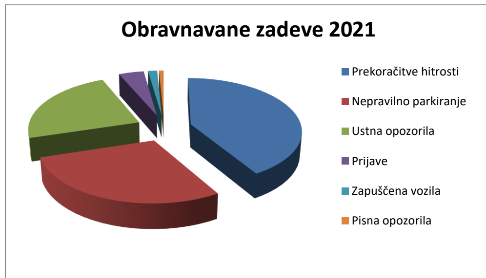
Graf 1: število obravnavanih zadev v letu 2021

Grafična ponazoritev obravnavanih zadev: